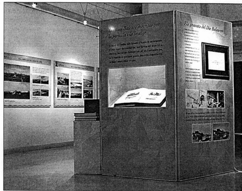
La muestra, expuesta en la sala de cultura de Sa Nostra de Ciutadella. Los organizadores de la exposición pretenden transportarla a la sala cultural de Sa Nostra de Maó, a partir del próximo mes de octubre.

de Sa Nostra programa visitas guiadas para alumnos de primaria y secundaria. La muestra se exhibirá a partir del mes de octubre en Maó. Lluç Julià además pretende trasladar esta idea en Mallorca, donde el Archiduque Luis Salvador de Austria también recopiló multitud de imágenes.